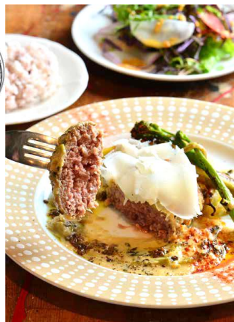
× Lunch × 大人気！ハンバーグランチ